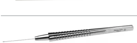
Pinzette, gebogen, 23 G