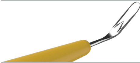
Gewinkeltes Tellermesser 2,0 mm