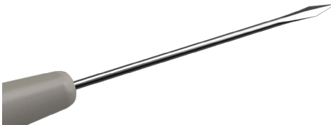
Gerades MVR-Messer, 23 G

Das Set beinhaltet die folgenden Instrumente: